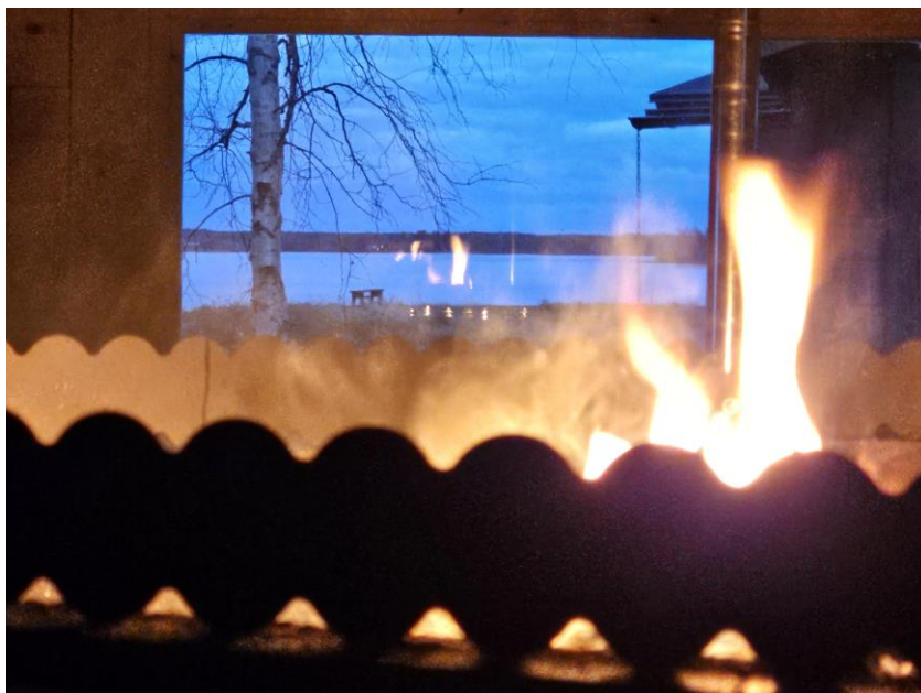
Tunnelmia kodan sisältä.

Jatkotoimenpiteenä esitetään Kajaanin kaupungin ympäristötekiselle toimelle satamarakennelmien kunnostamista. Kirppuniemi tulee toimimaan moottorikelkka- ja melontareitin taukopaikkana ja se yhdistetään kyläladulla Vuottolahden retkiluistelurataan. Kirppuniemen ylläpidosta on sovittu Vuottolahden nuorisoseura ry:n kanssa.