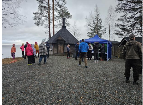
Kota, Bio-WC ja liiteri, kuva avajaisista.