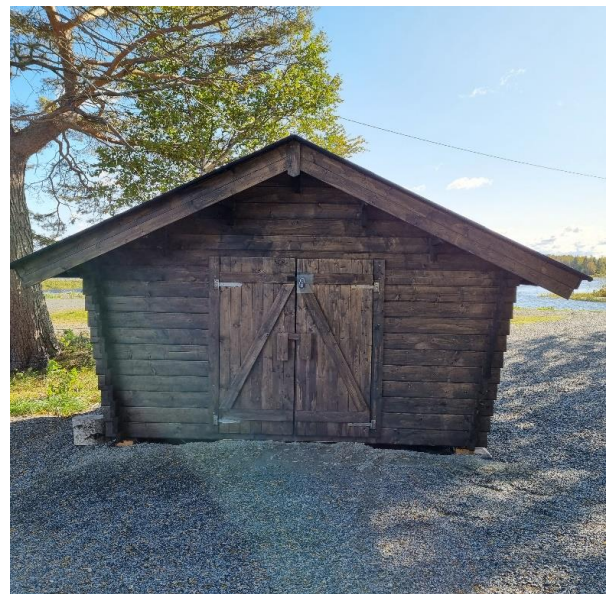
Liiteriin saatiin 1. erä lahjoituspuita.