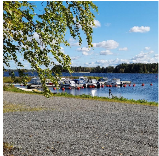
Kirppuniemen venesatama ja pysäköintialuetta.