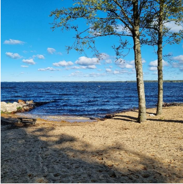
Uimapaikka on valmis.

Hankkeen toteuttaminen aloitettiin puuston poistolla ja maan muokkauksella. Alueelle ajettiin uimarannan kohdalle hiekka, traileriparkkiin ja piha-alueelle murske. Toteuttajana Malmisepele Oy.