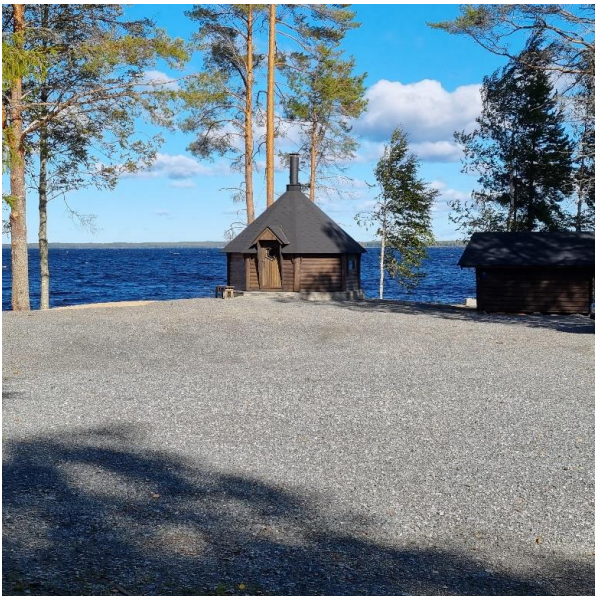
Kota on käyttövalmis.

Rakennusten hankinnat tehtiin Hyvän kaupan paikasta. Kota ja liiteri voitiin noutaa kohteeseen heinäkuussa, mutta, varasto-puucee ja bio-wc:n hankinnat venyivät syksyyn toimitusvaikeuksien vuoksi. Rakennusten kasaamisesta, perustuksista ja paikalle toimittamisesta vastasi Malmisepele Oy. Polttopuiden tekeminen ja rakennusten maalaaminen toteutettiin talkoilla, eikä kustannuksia näin ollen syntynyt.